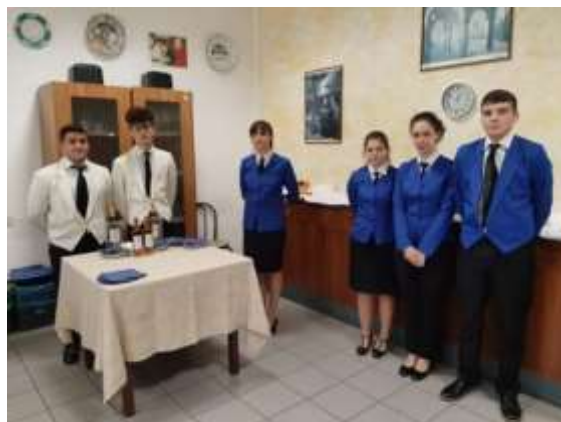
Foto: Studenti dell'Istituto Alberghiero di Assisi, in cucina e sala da pranzo.