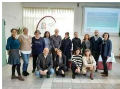
Foto: I membri del team di progetto

L'incontro di partenariato di apertura si è svolto presso l'Istituto Alberghiero di Assisi, partner del progetto insieme ad altre cinque organizzazioni e scuole di Belgio, Italia, Romania e Spagna.