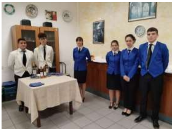
Fotos: Estudiantes del Istituto Alberghiero di Assisi, en la cocina y en el comedor.