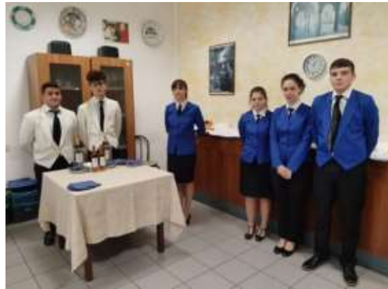
Fotografii: Studenții de la Istituto Alberghiero di Assisi, în bucătărie și sala de mese.