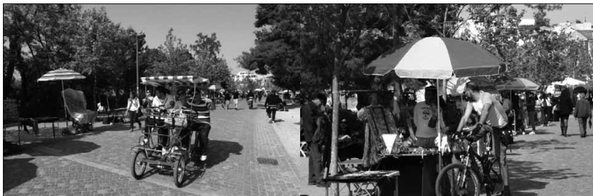
Figuras 3 y 4

La ruta peatonal también le da acceso al Odeón de Herodes Atticus también conocido como el Teatro de Irodion (figuras 5 y figura 6). Esta estructura de teatro en pie-