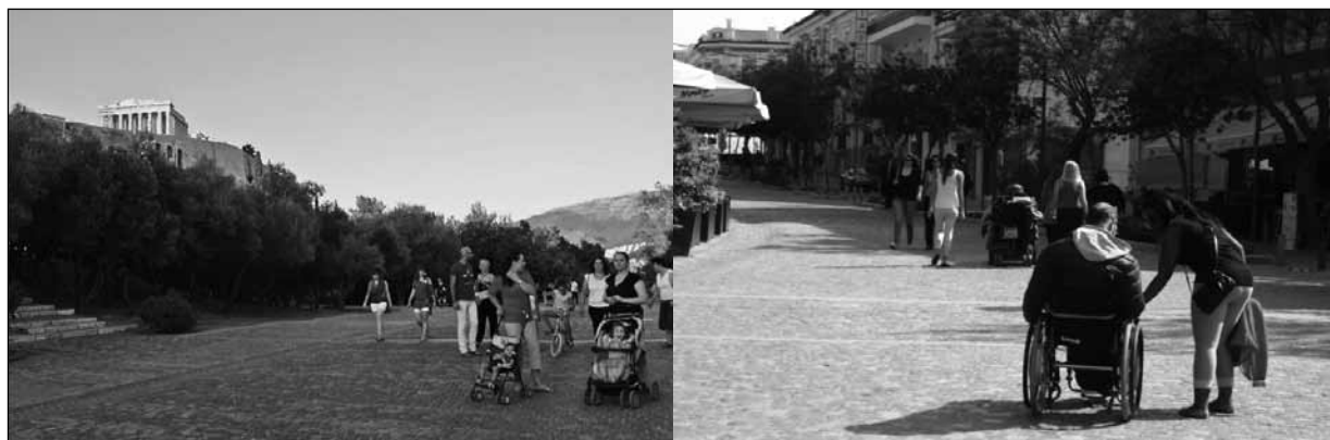
Figuras 1 y 2 El Gran Paseo

El programa de unificación, que comenzó en 2001, nació con el objetivo de restaurar la continuidad histórica de la ciudad y crear polos de atracción para sus residentes,