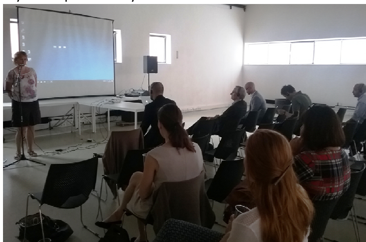
Závěrečná konference projektu ELEVATOR v Ostravě

Podrobnější informace o jednotlivých výstupech naleznete uvnitř zpravodaje. Již tradičně je část zpravodaje věnována také sdílení zkušeností a dobré praxe, které bylo součástí každého setkání partnerů. Toto poslední „sdílení“ proběhlo v ČR během závěrečné konference projektu, která se konala v červnu 2018 v Ostravě. Partneři na ní prezentovali nejen poznatky z průběhu realizace projektu, ale také své dlouholeté zkušenosti z oblasti přístupného cestovního ruchu a příklady dobré praxe ze svých zemí.