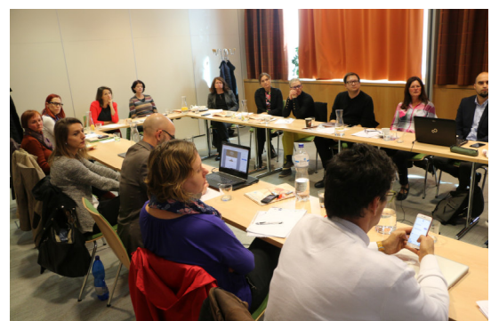
Slovenski udeleženci delavnice