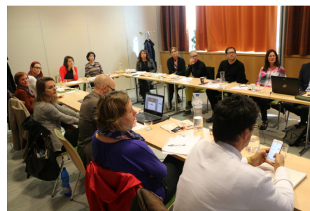
Workshop con i partecipanti sloveni.