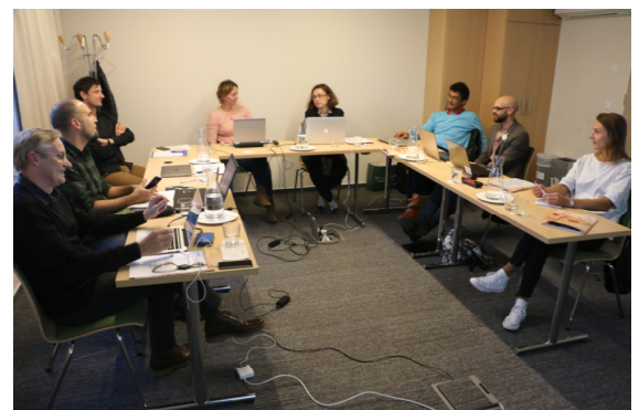
Il project team di ELEVATOR durante l'incontro in Slovenia