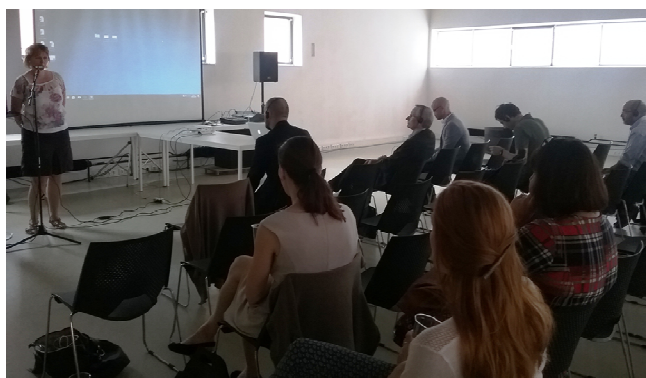
Fotografija: Zaključna konferenca projekta ELEVATOR v Ostravi

Del novic je namenjen tudi izmenjavi izkušenj in primerov dobrih praks, ki se izvaja na vsakem srečanju partnerjev. Zadnje srečanje je potekalo na Češkem v Ostravi (junija 2018) v času zaključne konference. Projektne partnerje so na konferenci poleg ugotovitev iz izvajanja projekta predstavili tudi svoje dolgoročne izkušnje iz področja dostopnega turizma ter primere dobrih praks v državah iz katerih prihajajo.