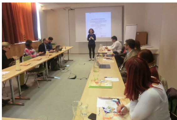
Workshop se slovinskými účastníky