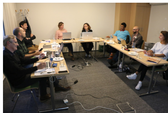
Setkání realizačního týmu projektu ELEVATOR v Lublani